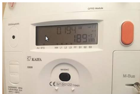
Foto: Slimme elektriciteits- en gasmeter

Je zal bij deze meter geen verzoek ontvangen om je meterstanden door te geven.