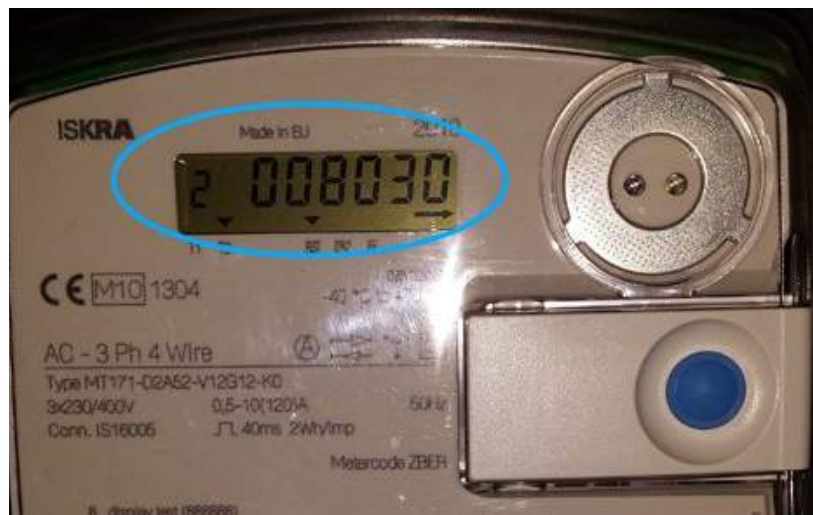
Foto: digitale elektriciteitsmeter

Je kan aan de hand van de knop tussen de verschillende telwerken wisselen om deze te noteren. Schrijf per telwerk het cijfer op (ook al is het 0)