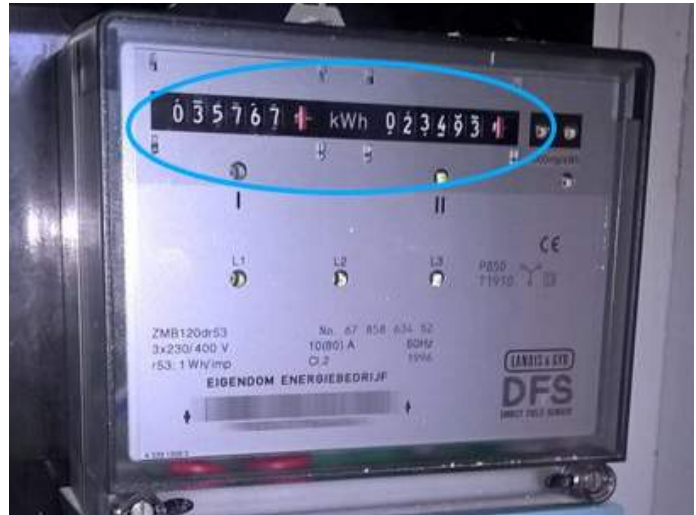
Foto: analoge elektriciteitsmeter zonder draaischijf

Zoals bij alle meters is het niet nodig om de cijfers na de komma op te schrijven. Ook kan je de streepjes weer vergelijken met een komma.